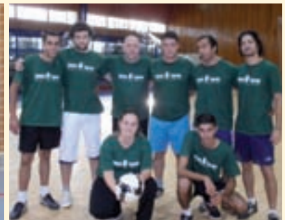
הניצחון במרכז. סניף מרכז, אלופי הטורניר, בירוק; הסגנית, קבוצת ההנהלה, בכחול

טל: 03-5395544 פקס: 03-5364444 מטה החברה: העממות 54, יהוד למשלוח דואר: ת.ד. 110 סביון 56915