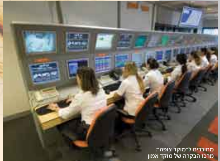
מחברים ל"מוקד צופה": מרכז הבקרה של מוקד אמון

חשבתם שרק "האח הגדול" רואה הכול? "מוקד צופה", מערכת שענינה פקוחה כל הזמן, מצלם ומקליט כל פריצה ומאפשר למוקד המבצעי לנקוט בתגובה מהירה