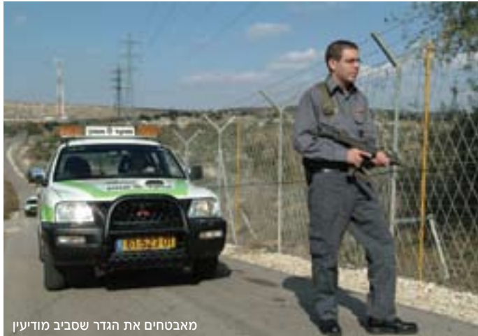
מאבטחים את הגדר שסביב מודיעין

בתחום הביטחון האישי, כמודיעין העתיד כבר כאן: קבוצת מוקד אמון פורשת מעל תושבי העיר מעטפת מיגון ואבטחה בכל מעגלי החיים. תפיסת "רשת הביטחון" עובדת מצויין גם ביישובים אחרים